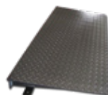
Rampa de acceso