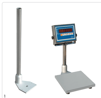
1 Columna en acero inoxidable de 300 mm. (Solo 300x300 mm) Colonne en acier peint de 300 mm. (Seulement 300x300 mm) 300 mm stainless steel column. (300x300 mm only)