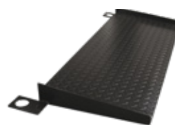
Rampa de acceso