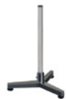
Columna en acero pintado