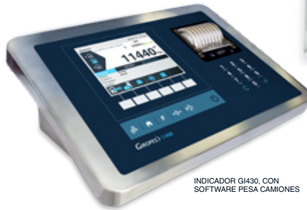
INDICADOR GI430, CON SOFTWARE PESA CAMIONES

INDICADORES PESO TARA Y MÚLTIPLES FUNCIONES