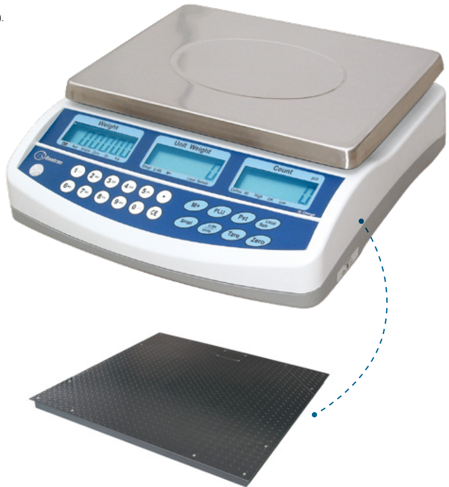
Conectable a plataforma auxiliar