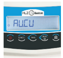
Guía de menú en pantalla